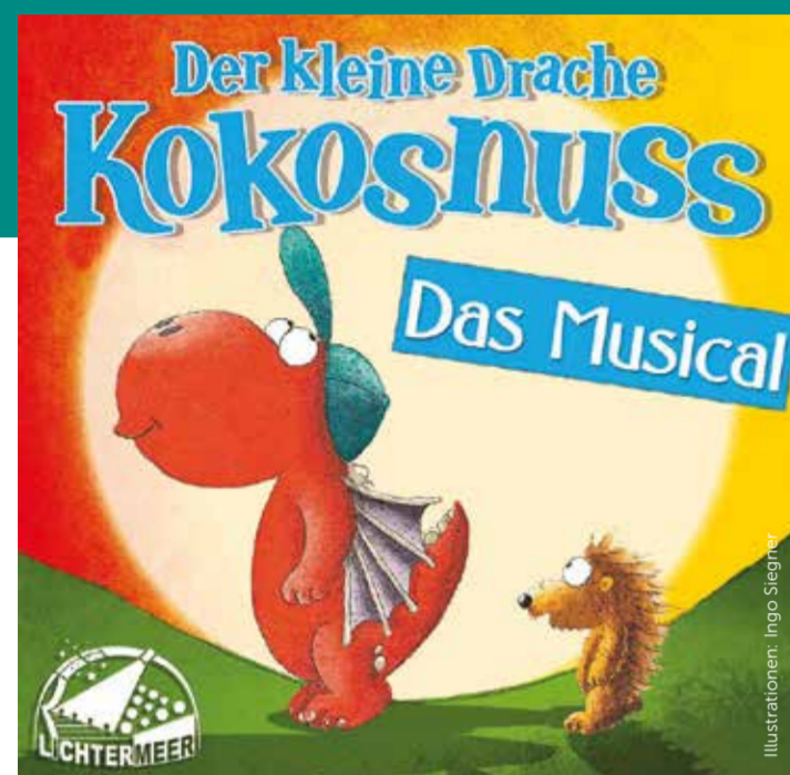
Illustrationen: Ingo Siegrist

Wie passt ein ganzes Land in eine kleine Flasche? Wieso ist Zauberer Holunder auf einmal so gar nicht mehr nett zu seinen Untertanen? Und was können der kleine Drache Kokosnuss und seine Freunde tun, damit im Flaschenland alles wieder gut wird? Wichtige Fragen und die müssen dringend geklärt werden. Also bricht der kleine Feuerdrache auf, zu einem ganz besonderem Abenteuer. Mit dabei sind natürlich auch das schlaue Stachelschwein Matilda und der Fressdrache Oskar (keine Angst, er ist Vegetarier). Der kleine Drache Kokosnuss ist die zur Zeit erfolgreichste Kinderbuchfigur Deutschlands – und nun live auf der Bühne! Empfohlen ab 4 Jahren. Dauer ca. 90min, zzgl. Pause.