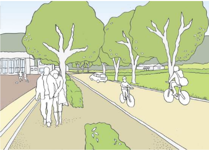
Promenade am Sportplatz