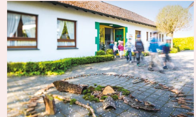
Kath. Kindergarten St. Raphael

Kath. Kindergarten St. Raphael | Kath. Kindergarten St. Marien