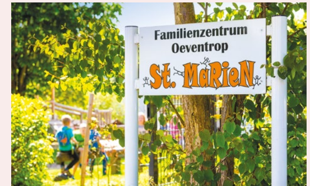
Kath. Kindergarten St. Marien