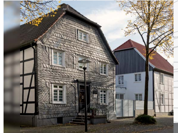
Veranstaltungsreihe » Regionale Baukultur – Identität & Qualität

» 06. Dezember 2013 » 11.00 - 16.00 Uhr » Rathaus Arnsberg-Neheim