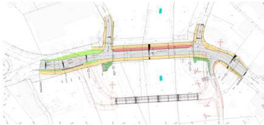
NEUBAU mit BEHELFSBRÜCKE (Lageplan, Straßen.NRW, Januar 2020)

Für den Neubau der Brücke über die Ruhr wurden mit dem zuständigen Landesbetrieb Straßen.NRW Absprachen für einen qualitativ hochwertigen und optisch ansprechenden Neubau getroffen. Um auch während des Baus der neuen „Dinscheder Brücke“ den Verkehr über die Ruhr zu ermöglichen, soll bis Ende 2021 eine Behelfsbrücke gebaut werden, die zurzeit statisch und konstruktiv geplant wird. Nach Inbetriebnahme kann mit dem Abriss der alten Brücke sowie der Fuß- und Radwegebrücke aus Holz begonnen werden, um anschließend die neue Brücke zu errichten. Dabei wird deren neuer Querschnitt dazu führen, dass sich die Höhenlage der Anbindung „In den Oeren“ verändert. Dies wird aller Voraussicht dazu führen, dass die Zufahrt zur Straße „In den Oeren“ vorübergehend geschlossen und der vordere Straßenabschnitt bis zum Ende des Grundstücks der Schützenhalle inklusive der darin befindlichen Versorgungsleitungen vollständig erneuert werden muss.