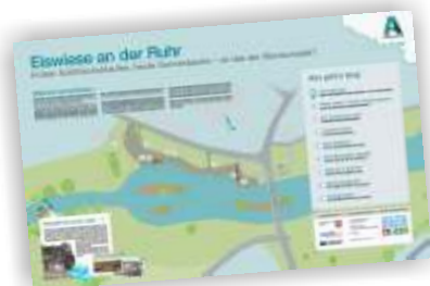
INFOTAFEL (anke-peters.design, 2020)