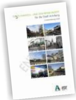
EINZELHANDELSKONZEPT (Stadt Arnberg, Junker+Kruse, 2020)

Zu Inhalten und Änderungen auch für das Nahversorgungszentrum Oeventrop mit der Ergänzung eines Sonderstandortes Widaymarkt wird auf die Beschlussvorlage 56/2020 verwiesen.