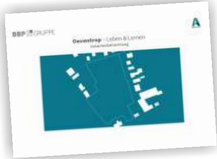
VARIANTENUNTERSUCHUNG (BBP Ingenieure, Dortmund, 2020)

Auf der Basis einer Bewertung der eingegangenen Angebot soll die Vergabe der Leistungen bis Anfang Juni erfolgen.