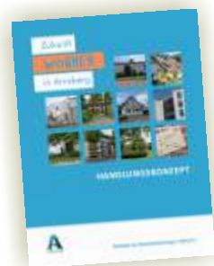
HANDLUNGSKONZEPT WOHNEN (Stadt Arnberg, 2019)

Im Rahmen der Variantenuntersuchung „Leben & Lernen“ wurde der nördliche Bereich als Entwicklungsfläche für integriertes Wohnen identifiziert. Im Rahmen der weiteren Planungen soll dieser Bereich fortentwickelt werden.